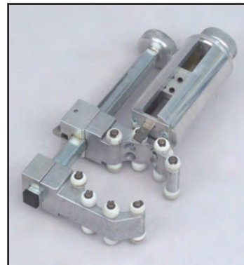
DA 32 - 110 mm